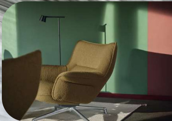
Home Design Let's get cozy