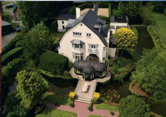
Pleasure & business « Rêve by Gregoir »