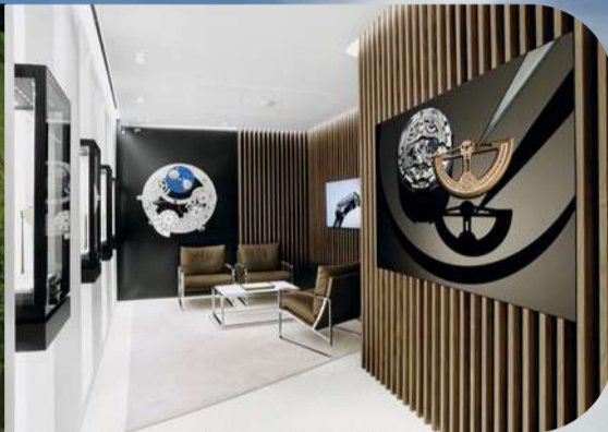
Watches IWC by Hall of Time